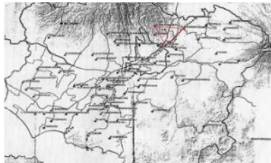
Gambar 4.1 Peta DAS Wilayah Kabupaten Jember