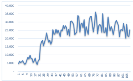
Gambar 2.1: Data Time Series