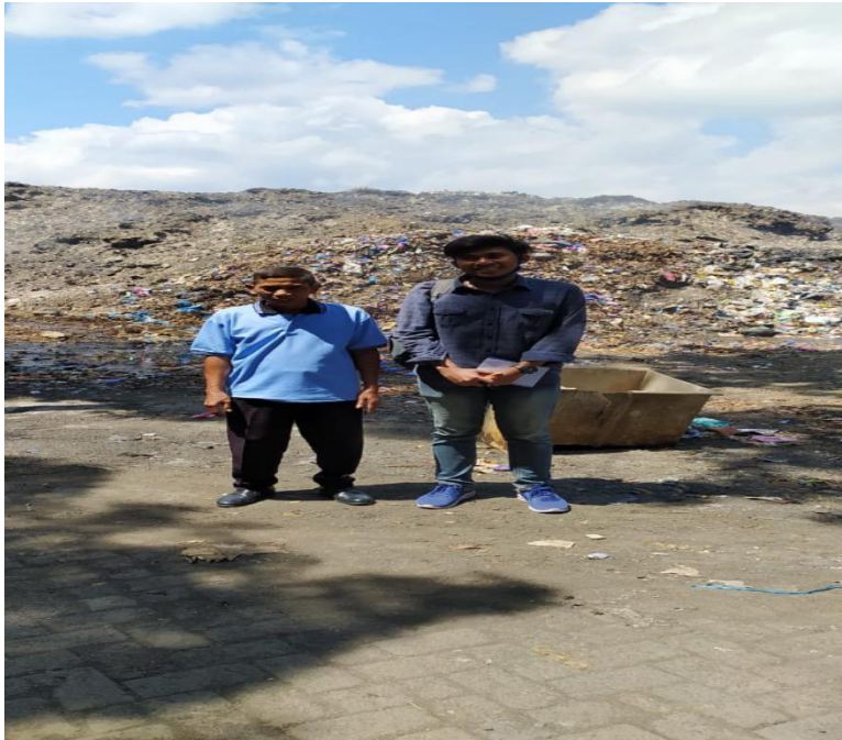
Foto-foto dilokasi TPA Pakusari