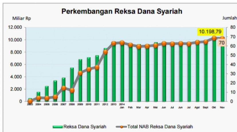
Gambar 2. Grafik Perkembangan Reksadana Syariah

Namun penelitian ini lebih menfokuskan pada reksadana saham dan reksadana pendapatan tetap, baik syariah maupun konvensional. Alasannya adalah adalah (1) reksadana saham merupakan jenis reksadana yang paling banyak diminati oleh para investor karena return nya cukup tinggi, reksadana yang mayoritas berbasis saham masih paling banyak peminatnya. Berdasarkan data OJK per 31 Oktober, jumlah dana kelolaan reksadana saham ini mencapai Rp 90,59 triliun, atau 42,64% dari keseluruhan dana. (2) Reksadana pendapatan