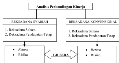
Gambar 3. Model Hipotesis Penelitian

Sampai dengan periode 2010-2014, terdapat 42 reksadana saham konvensional yang masih tetap aktif dari tahun penerbitanya sebelum hingga 2014 kemudian ada 92 untuk reksadana pendapatan tetap konvensional. Selanjutnya untuk reksadana saham syariah yang tetap aktif sebelum tahun 2010-2014 terdapat 22 reksadana, sementara untuk reksadana pendapatan tetap syariah terdapat 8. Dalam hal ini, dari sejumlah populasi tersebut dikeriteriakan dengan metode puposive sampling dan terpilih sebanyak 5 reksadana saham konvensional, 5 reksadana pendapatan tetap konvensional, 5 reksadana saham konvensional serta 3 untuk reksadana pendapatan tetap syariah yang memenuhi sebagai sampel penelitian.