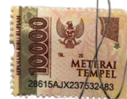
Aulia Fitri Nurul Firdaus