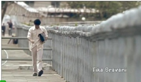
5 Gambar 1