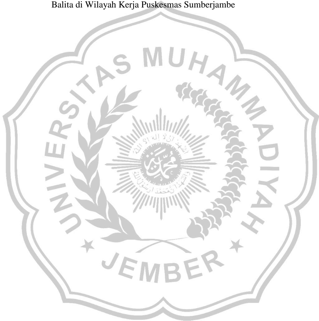
Tabel 3.1 Kerangka Konseptual Penelitian Hubungan Riwayat Sakit dan Pemberian Makanan Pendamping ASI (MP-ASI) dengan Kejadian Stunting Pada Balita di Wilayah Kerja Puskesmas Sumberjambe