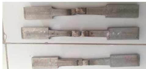
Gambar 2. Spesimen Pengujian

Setelah proses pengelasan selesai maka dilanjutkan pembuatan spesimen sesuai JIS Z 2201 1981, yang nantinya akan diuji tarik, langkah-langkahnya sebagai berikut: