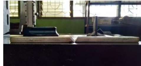
Gambar 1. Sambungan Kampuh V