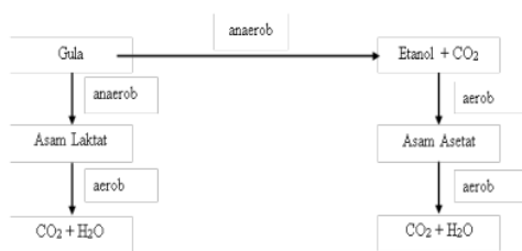
Gambar 3. Skema Perubahan Kimiawi dalam Pulp selama Proses Fermentasi

Berdasarkan data hasil pengamatan dapat dijelaskan bahwa proses fermentasi tidak bisa lepas dari peran serta bakteri asam, terutama bakteri asam laktat dan bakteri asam asetat. Untuk lebih jelasnya dapat ditunjukkan pada Gambar 3.