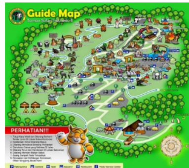
Gambar 2. Peta Kebun Binatang Taman Safari Prigen

Pada bagian ini akan dibahas mengenai morfologi peta Kebun Binatang Taman Safari Prigen untuk kemudian ditentukan bilangan dominasi jarak duanya. Peta Kebun Binatang Taman Safari Prigen dapat dilihat pada Gambar 2. Langkah awal adalah menentukan peta ke dalam sebuah graf. Kemudian gambar tersebut direpresentasikan menjadi graf, dimana pada graf tersebut persimpangan jalan direpresentasikan sebagai simpul dan setiap jalan direpresentasikan sebagai sisi. Representasi peta Kebun Binatang Taman Safari Prigen dapat dilihat pada Gambar 3. Dari representasi graf tersebut akan ditetapkan lokasi penempatan pos pengamanan pada simpul-simpul tertentu, sehingga dengan menggunakan Teori Bilangan Dominasi jarak 2 akan didapat jumlah pos pengamanan seminimal mungkin tanpa mengurangi efisiensinya.