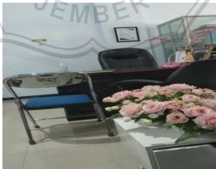
Gambar 4 : Ruang Pimpinan Klinik Suherman Jember