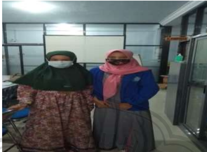
Gambar 2 : Foto bersama karyawan Klinik bagian Umum dan Humas