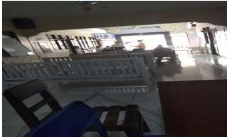
Gambar 5 : Ruang tunggu Klinik Suherman Jember