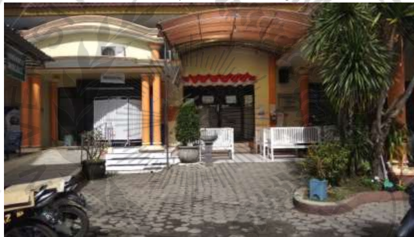
Gambar 3 : Klinik Suherman Jember