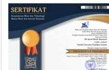
SINTA Accreditation Certificate