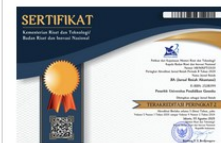
SINTA Accreditation Certificate