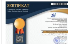
SINTA Accreditation Certificate