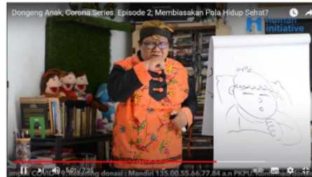
Gambar 5. Mendongeng sambil menggambar anak sakit