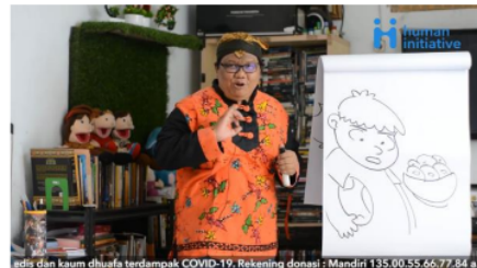
Gambar 4. Mendongeng sambil menggambar pulang bermain langsung makan