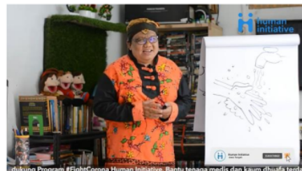
Gambar 3. Mendongeng sambil menggambar mencuci tangan

c. Interpretant : Gambar mencuci kedua telapak tangan dengan air