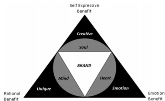
Gambar 3: Brand Genius (Sumber : Manap, 2016 ; 276)

menciptakan keunggulan baru. Kreativitas akan merangsang inovasi yang mampu membuahkan keunikan-keunikan yang merevolusi pemasaran. Sehingga pelanggan akan terus penasaran dan terus melakukan pembelian. Berikut gambar tentang konsep brand genius :