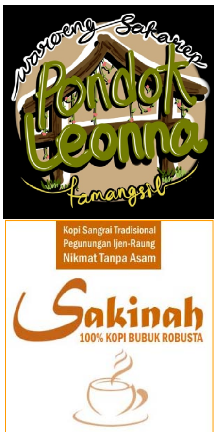
Gambar 1 : Perbandingan Brand Kopi Pondok Leonna dan Kopi Sakinah

Kopi Sakinah dan kopi Pondok Leonna adalah produk yang sama, yang dikemas ulang. Dalam waktu 2 bulan, kopi Sakinah telah diproduksi sebanyak 40 kg sedangkan kopi Pondok Leonna tetap terjual di bawah angka 5 kg. Produksi kopi Pondok Leonna bertahan di angka di bawah 5 kg per bulan selama kurun waktu 5 tahun terakhir. Kehadiran Kopi Sakinah mendominasi produk kopi Pondok Leonna.