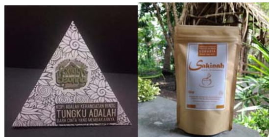
Gambar 5 : Perbandingan Kemasan Kopi Pondok Leonna dan Kopi Sakinah

Penelitian ini juga menyoroti perubahan bentuk pada kemasan produk dari limas dengan bahan dasar kertas Art Paper 220gr yang rumit dalam pengerjaan menjadi lebih praktis dan kekinian. Produk kopi Sakinah berusaha beradaptasi dengan trend produk jenis industri rumah tangga yang lebih simpel dan minimalis yaitu menggunakan kemasan standing pouch paper kraft yang mudah dibuka dan ditutup. Di bawah ini adalah transformasi bentuk kemasan Kopi Leonna menjadi Kopi Sakinah.