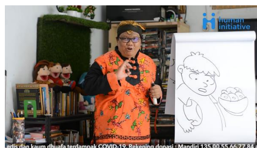
Gambar 4. Mendongeng sambil menggambar pulang bermain langsung makan

c. Interpretant : Gambar pertama seorang anak sedang memegang bola dengan tangan kanannya. Ekspresi yang diperlihatkan adalah wajah kelaparan dan kehausan setelah bermain bola dan melihat sesuatu yang sangat diinginkan anak tersebut. Gambar kedua, ilustrasi tersebut ditambahkan semangkok donat yang menggiurkan