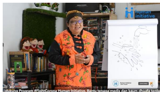
Gambar 3. Mendongeng sambil menggambar mencuci tangan