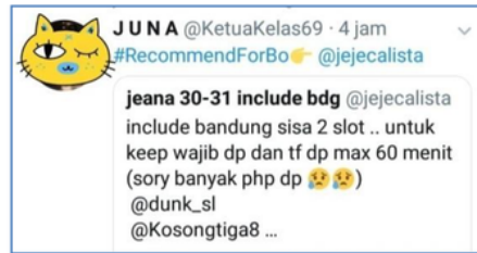
Gambar 1. Iklan Prostitusi Online di Twitter 1

Ada beberapa tanda yang muncul dalam iklan di atas. Namun peneliti tertarik untuk mengkaji lebih dalam adalah kata slot . Dengan menggunakan pendekatan analisis tekstual, tanda slot dapat dijabarkan sebagai berikut :