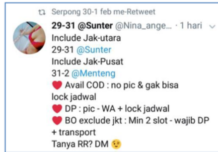
Gambar 3. Iklan Prostitusi Online di Twitter 3

Prinsip lainnya adalah actuating atau pelaksanaan kerja. Fungsi slot sebagai batasan waktu pelayanan diharapkan dapat mengoptimalkan kinerja sehingga dapat memberikan pelayanan prima dan maksimal. Banyaknya faktor yang mempengaruhi prima tidaknya sebuah pelayanan. Namun dengan pembatasan waktu pelayanan memberikan kesempatan untuk mempersiapkan diri pada pelayanan selanjutnya sesuai jadwal yang telah disepakati.