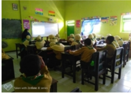
Gambar 2. Siswa diminta bersama Kelompok untuk menyusun Proyek Ecobrick