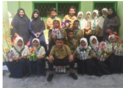
Gambar 4. Hasil Produk Ecobrick tiap Kelompok

Penelitian empiris telah menunjukkan bahwa pembelajaran di bidang seni dapat meningkatkan aktivitas siswa, pemikiran kritis, inovasi, kolaborasi dan keterampilan antarpribadi (NAEA, 2016). Indikator kemampuan berpikir kritis yang digunakan dalam penelitian ini yaitu: Memberikan definisi, memberikan argumen, melakukan deduksi, melakukan induksi, dan melakukan evaluasi. Pembelajaran STEAM membuat siswa menghargai bagaimana seni dan sains bersama-sama menggunakan banyak bentuk kemampuan berpikir kritis, kreativitas, dan imajinasi ketika mereka memahami berbagai masalah nyata. (Wilson & Hawkins, 2019). Taylor (2016) memberikan beberapa poin penting terkait pembelajaran dengan STEAM : pendidik STEAM dapat mengambil inspirasi dari pembelajaran berbasis proyek, pembelajaran STEAM melibatkan siswa dalam pembelajaran transformatif, yang didasarkan pada lima cara pengetahuan yang saling berhubungan: pengetahuan budaya, pengetahuan rasional, pengetahuan kritis, pengetahuan visioner dan etis, dan pengetahuan dalam tindakan (Kebudayaan, 2013).