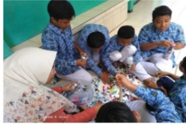
Gambar 3. Merancang bentuk Ecobrick