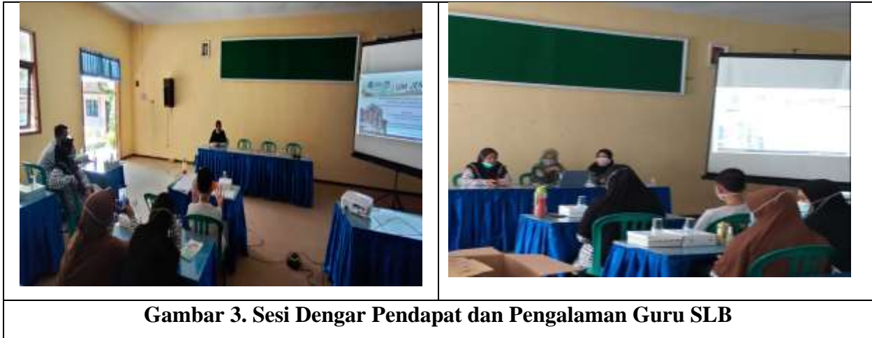
Gambar 3. Sesi Dengar Pendapat dan Pengalaman Guru SLB

ini didapatkan bahwa secara teoretis berbagai materi dan teori turut mendukung tindakan praktis yang sebenarnya terdapat di lapangan.