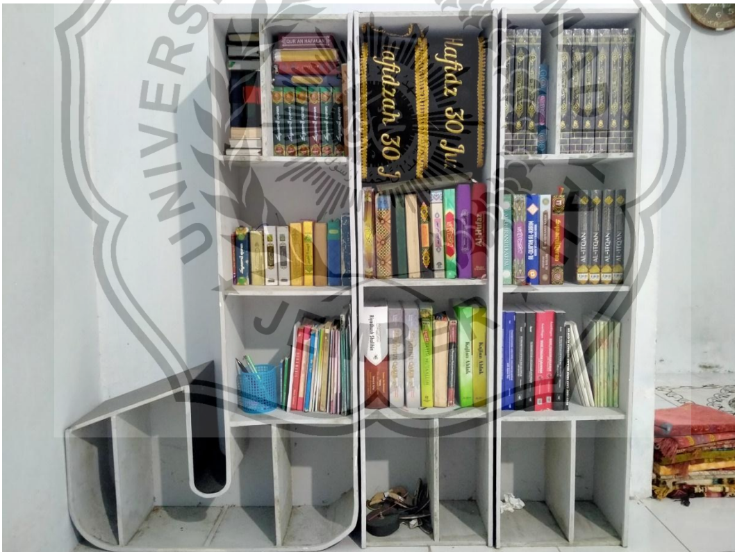
Gambar 12. Foto Lemari Qur'an dan Buku-buku Pondok Tahfidz Jember Islamic Institute (JII)