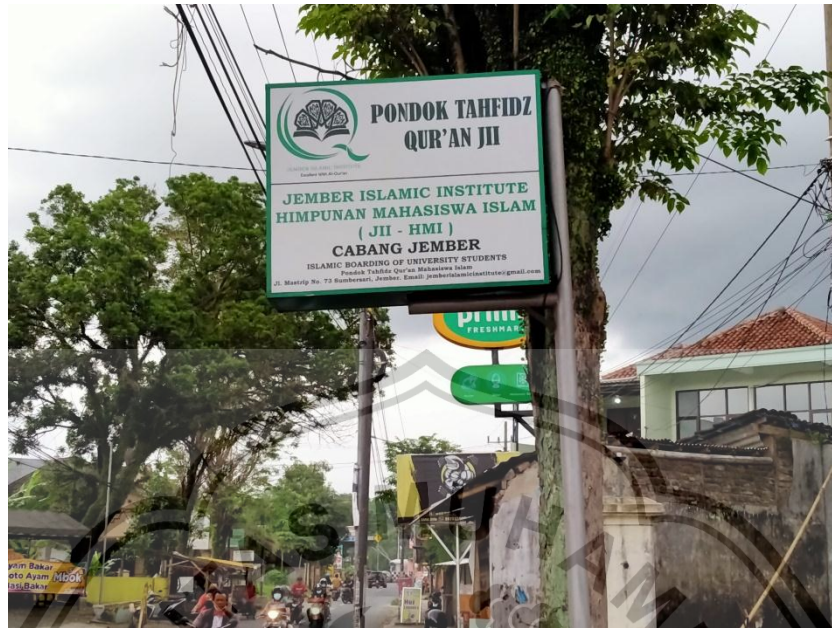
Gambar 6. Papan Nama Pondok Tahfidz Jember Islamic Institute (JII) yang Terlokasi di Jl. Mastrip No 73 Sumbersari Jember