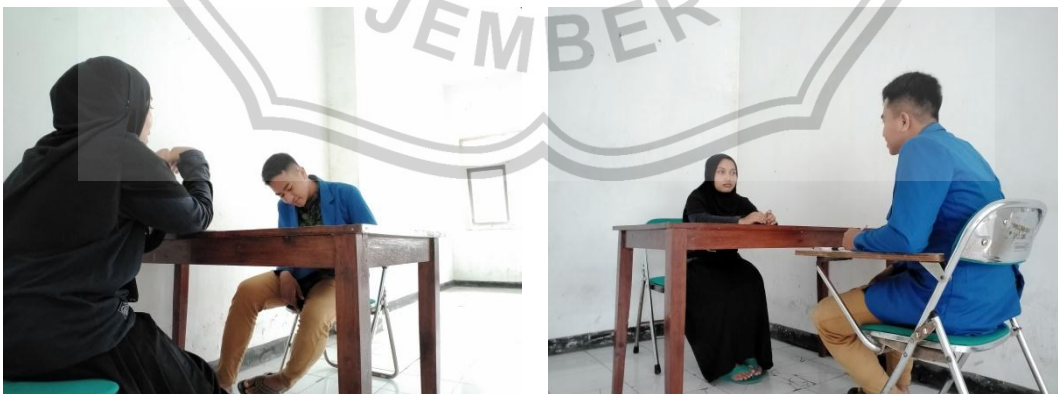
Gambar 3. Wawancara Ketua Umum (Pengurus) di Pondok Tahfidz Jember Islamic Institute (JII)