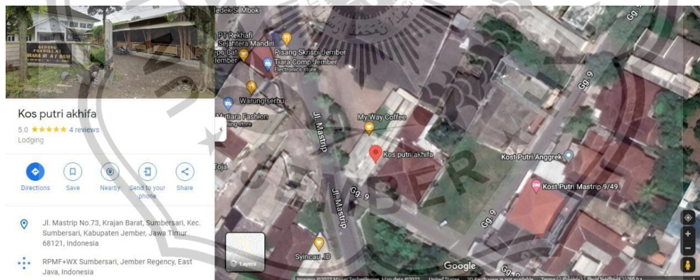
Gambar 18. Denah Jl. Mastrip No.73 Sumbersari Jember