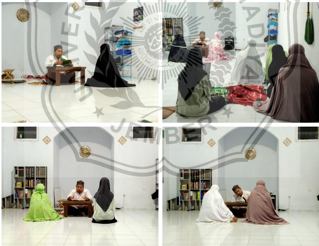
Gambar 14. Suasana Setoran Santriwati Pondok Tahfidz Jember Islamic Institute (JII)