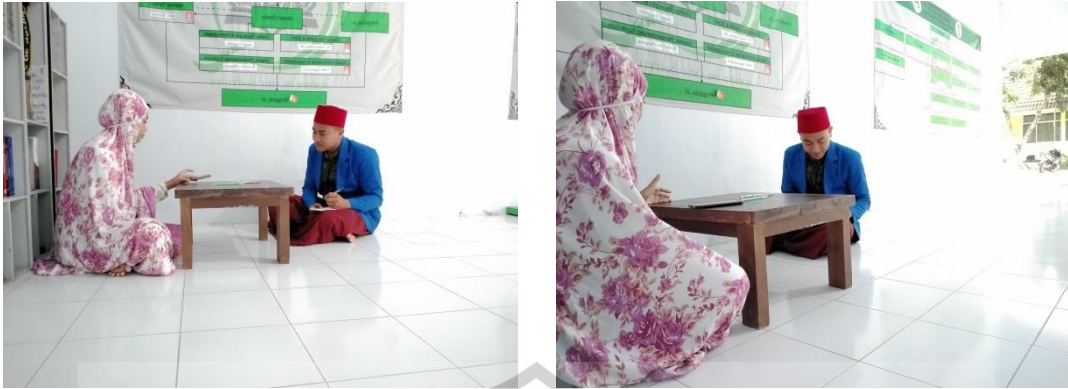
Gambar 4. Wawancara Santriwati Aktif (Progres) di Pondok Tahfidz Jember Islamic Institute (JII)