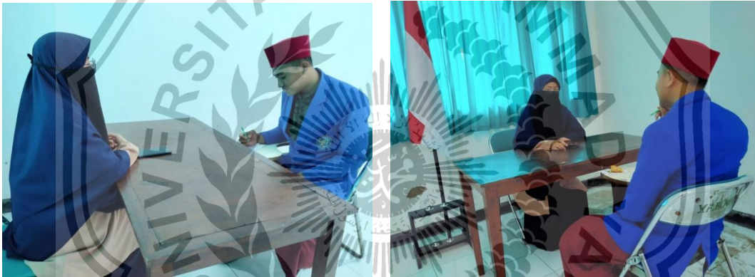
Gambar 2. Wawancara Dewan Direksi Pondok Tahfidz Jember Islamic Institute (JII)