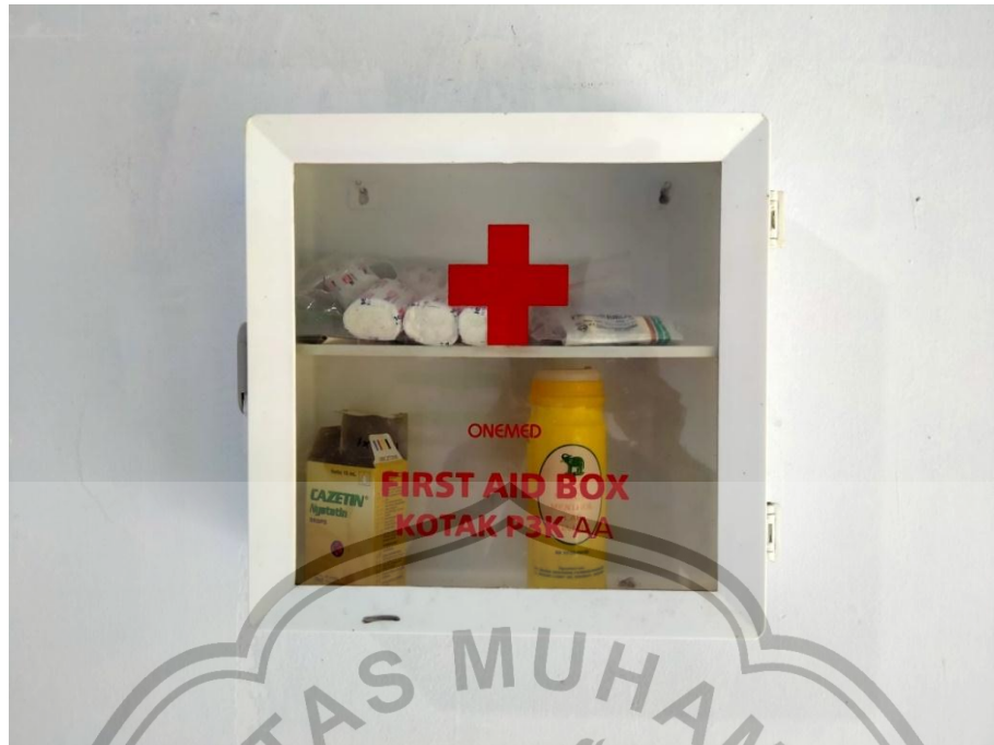
Gambar 13. Foto P3K Pondok Tahfidz Jember Islamic Institute (JII)