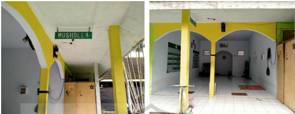
Gambar 8. Foto Musholla Pondok Tahfidz Jember Islamic Institute (JII)