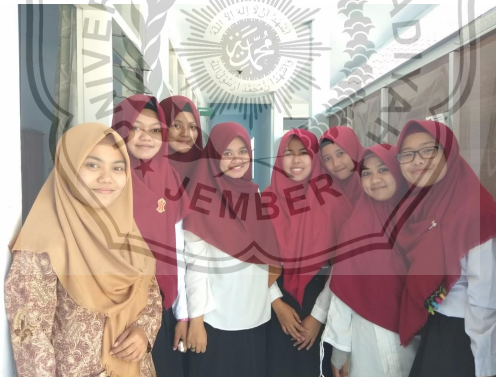
Gambar 16. Suasana Santriwati saat Menjalin Keharmonisan Sesama Santriwati