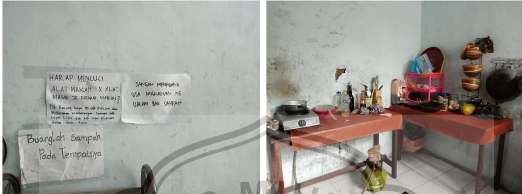
Gambar 11. Foto Dapur Santriwati Pondok Tahfidz Jember Islamic Institute (JII)