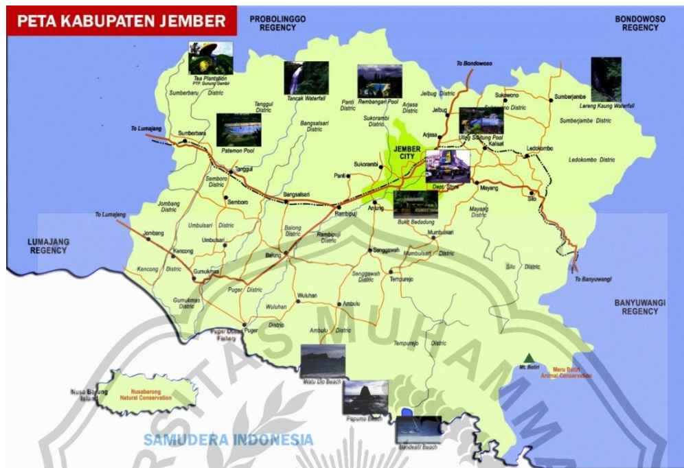
Gambar 17. Peta Kabupaten Jember