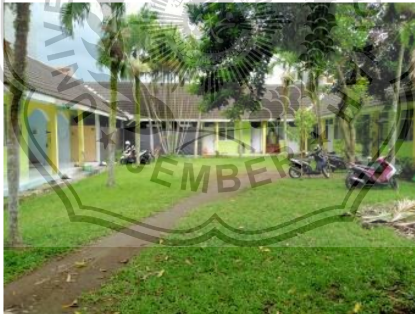
Gambar 7. Lingkungan Pondok Tahfidz Jember Islamic Institute (JII)