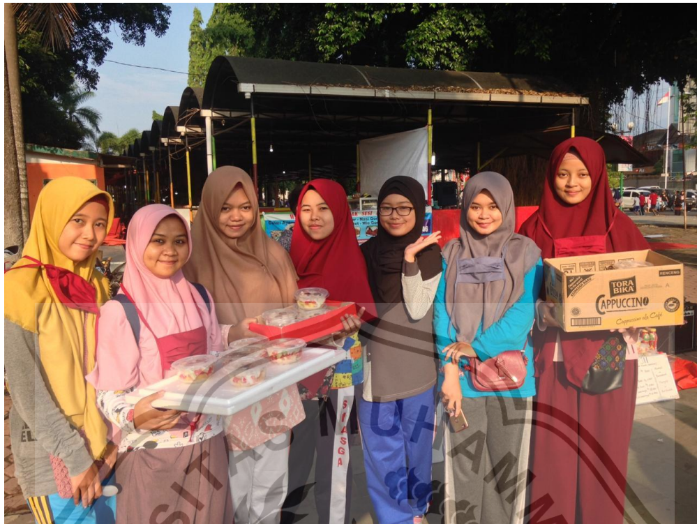
Gambar 15. Suasana Santriwati yang Pernah Jualan di Alun-alun Jember