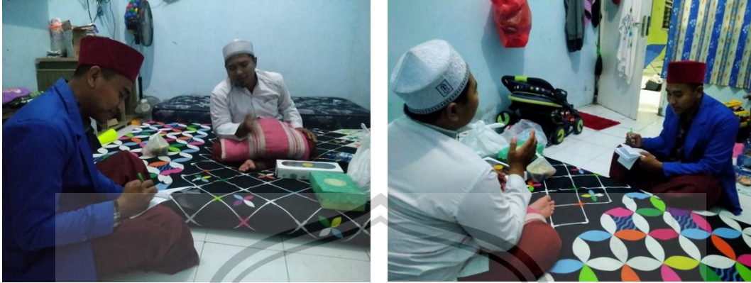
Gambar 1. Wawancara Ustadz Pondok Tahfidz Jember Islamic Institute (JII)