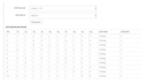
Gambar 3. 3 Tampilan Halaman Testing

Setelah dilakukan pengujian pada halaman testing didapatkan hasil akurasi, presisi dan recall seperti pada tabel dibawah ini :