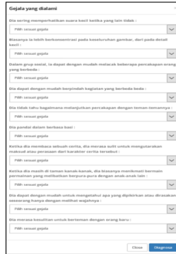
Gambar 3. 2 Tampilan halaman Deteksi Autis