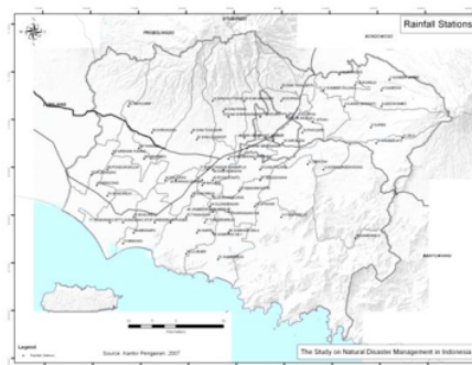
Gambar 2. Peta stasiun curah hujan