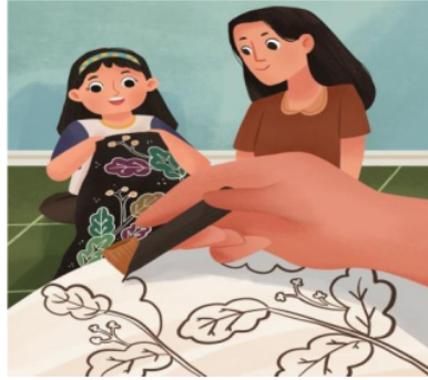
Gambar 4 Ilustrasi dalam Buku

Ilustrasi tersebut menunjukkan tokoh Yusi yang sedang membatik bersama sang Bunda. Lukisan daun tembakaunya pun sesuai dengan ciri khas batik Jember. Hal ini sejalan dengan cerita yang terdapat dalam naskah berjudul “ Lukisan Daun Tembakau. ”