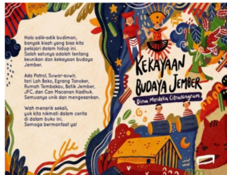
Gambar 3 Cover buku

Penyajiannya dalam buku tersebut merefleksikan nilai yang bermuatan kearifan lokal Jember yaitu mengangkat kesenian Patrol Jember, Suwar-suwir, Tari Lah Bako, Rumah Tembakau, Batik Jember, JFC, dan Can Macanan Kadhuk. Dari segi penampilan, bahan, dan kualitas cetak sudah cukup baik dan buku dijilid dan tidak mudah rusak, ukuran huruf sesuai dengan kemampuan pembaca, serta sesuai dengan tingkat pemahaman pembaca.