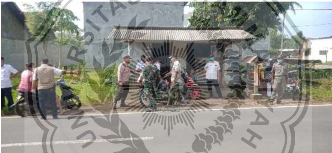
Foto 2. Operasi Yustisi dan Pembagian Masker