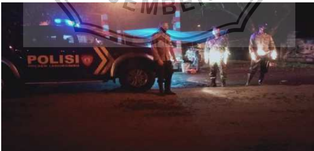
Foto 3. Patroli Malam