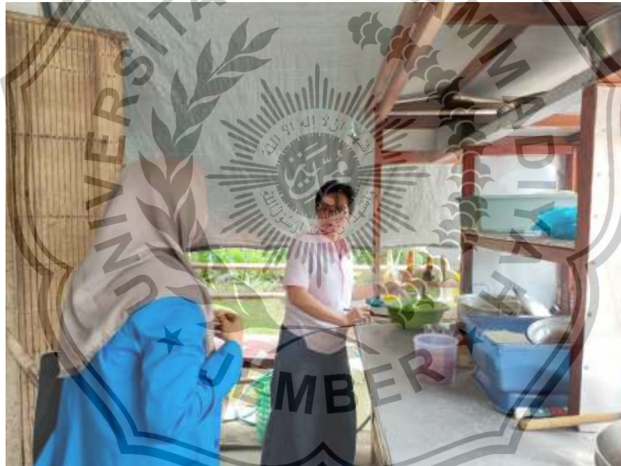
Foto 4. Wawancara dengan pelaku usaha mikro, 14 Maret 2022