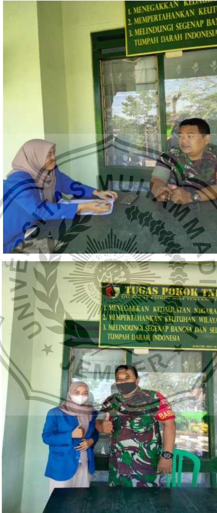
Foto 3. Wawancara dengan Anggota Koramil Ledokombo, 17 Maret 2022