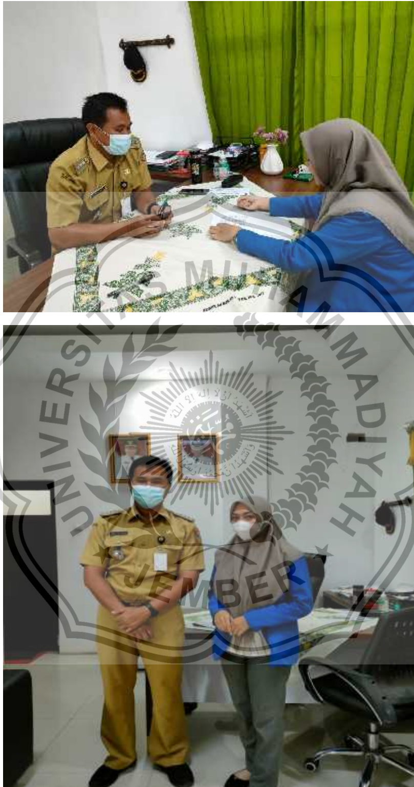
Foto 1. Wawancara dengan Camat Ledokombo, 14 Maret 2022