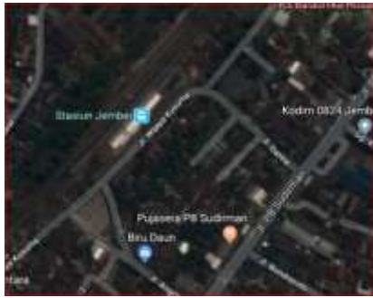
Gambar. 1.1 Lokasi Penelitian Tugas Akhir

Sarana transportasi dari tahun ke tahun mengalami kenaikan dalam jumlah volume kendaraan. Disini diperlukan pelayanan kepada masyarakat dengan baik, terutama transportasi darat. Kereta api merupakan transportasi darat yang dapat mengangkut jumlah penumpang yang banyak dalam sekali perjalanan dibanding sarana lain, seperti bus, kapal terbang, dll. Perlu dilakukan sebuah upaya peningkatan sarana Stasiun Kereta Api mengenai kebutuhan ruang maupun fasilitas dan kualitas pelayanannya, maka dari pihak PT.