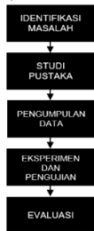
Gambar 1. Metode Penelitian

Tahapan-Tahapan metode yang dilakukan pada penelitian ini adalah sebagai berikut (Rahman, M. 2019):