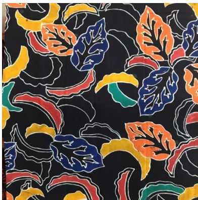
Gambar 1. Batik Khas Kabupaten Jember

Konten quantity perlu dikembangkan karena berkaitan langsung dengan aktivitas manusia dalam kehidupan sehari-hari seperti dalam menukar kurs mata uang, menentukan bunga bank, berbelanja, menghitung pajak, mengukur waktu, mengukur jarak dan lain-lain (Anisah, Zulkardi, & Darmawijoyo, 2011). Selain itu, hasil literasi matematika pada konten quantity masih tergolong rendah bila dibandingkan dengan konten-konten yang lain. literasi matematis siswa pada konten quantity masih tergolong rendah, yaitu 25,9. Sedangkan capaian literasi matematis pada konten uncertainty and data, change and relationship , dan space and shape berturut-turut 32,8; 26,0; dan 25,8 (Mahdiansyah & Rahmawati, 2014). Materi dalam konten quantity seperti bilangan dan pola bilangan sendiri sudah ditempuh atau dipelajari oleh siswa kelas VIII SMP, sehingga soal PISA yang akan diberikan atau diujikan kepada siswa tersebut akan lebih mudah untuk dipahami dan dikerjakan nantinya.