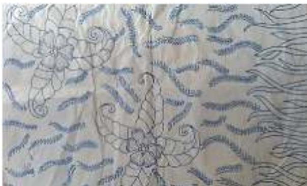
Gambar 3.2 Corak Nugroho Agung