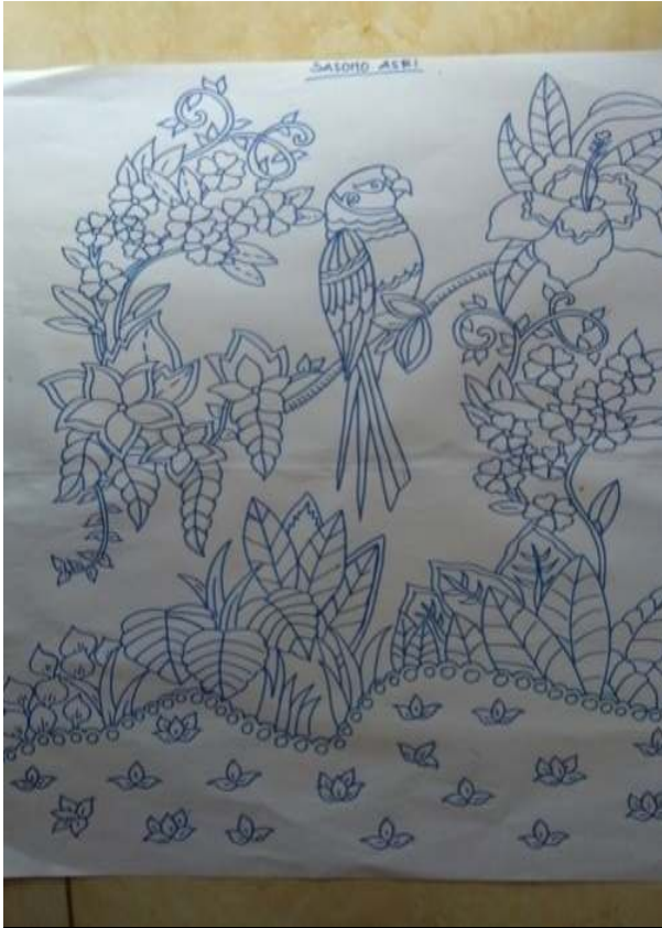
Gambar 3.3 Corak Sasono Asri

Corak lainnya yang diciptakan adalah corak Liris Langon. Corak Liris Langon menggambarkan kehidupan masyarakat yang beragam namun mengutamakan nilai-nilai kebersamaan, selalu menjaga kerukunan dan ringan tangan dalam membantu sesama. Filosofi ini digambarkan oleh gambar bermacam-macam daun namun