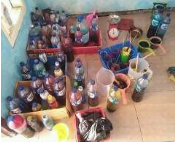
Gambar 3.7 Tinta Kimia Khusus Batik

Lamanya proses pewarnaan juga tergantung pada sketsa gambar yang ada di kain. Jika kain penuh dengan sketsa gambar maka prosesnya akan memakan waktu lebih lama. Ini berbeda dengan jika sketsa gambar hanya terdapat di beberapa sudut kain. Pembatik hanya akan memberi warna di sudut kain yang ada gambarnya. Setelah pemberian warna selesai dilakukan, ditunggu hingga warna mengering. Setelah warna pada gambar mengering dilanjutkan oleh proses memberikan warna dasar.