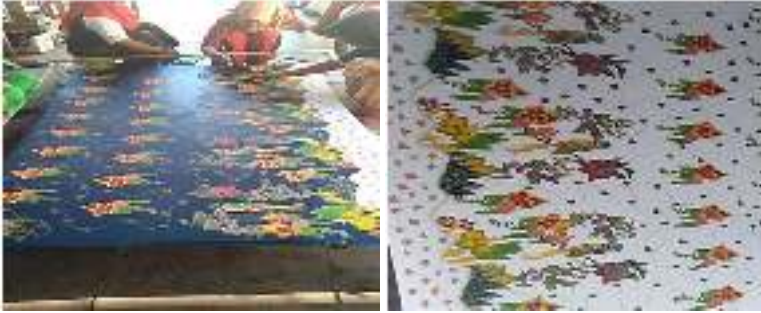
Gambar 3.8 Pemberian Warna Dasar dan Warna pada Sketsa Sasono Asri