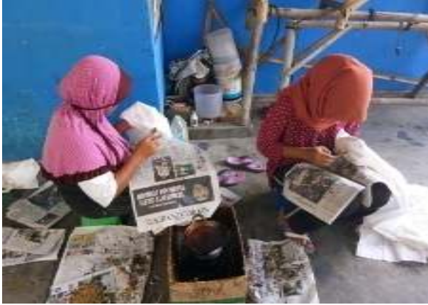
Gambar 3.6 Proses Pencantingan

Setelah proses pencantingan dilanjutkan dengan proses pewarnaan. Kain yang sudah memuat sketsa batik diberi warna sesuai yang dikehendaki. Pembatik ada kala menggunakan warna alami dan atau warna kimia. Pilihan jenis warna yang digunakan disesuaikan dengan pemesan. Warna alami lebih mahal dari pada warna kimia. Pemesan cenderung memilih warna kimia. Proses pewarnaan juga tidak bisa selesai dalam satu hari tergantung pada detail warna yang diinginkan dan variasi gambar.