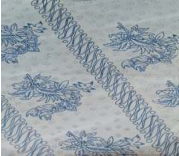
Gambar 3.4 Corak Liris Langon

daun tersebut menyatu. Pemakai batik motif Liris Langon diharapkan memiliki jiwa yang luhur dan mengutamakan kebersamaan.