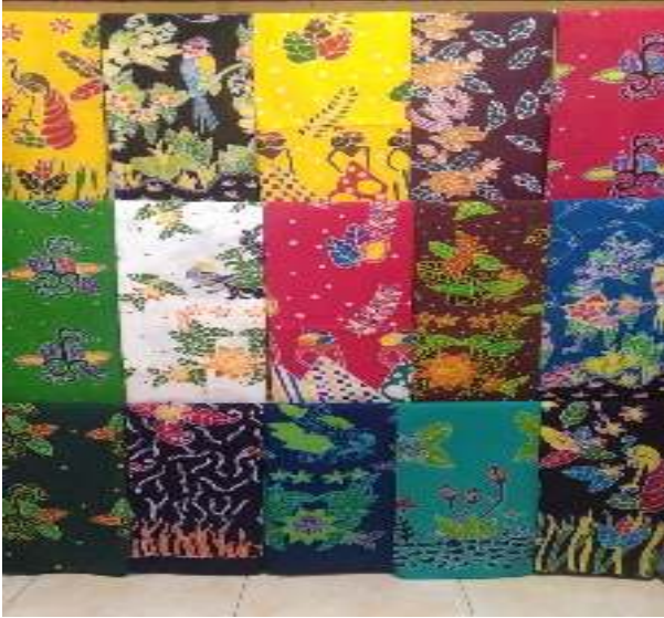
Gambar 3.9 Kain batik dengan corak baru

Pada saat mengikuti pameran produk UMKM yang diselenggarakan oleh Pemerintah Kabupaten Jember, kain batik yang salah dalam teknik pewarnaan ini diletakan di sebelah kain batik yang menurutnya bagus dan pembuatannya sempurna. Ibu Hj. Siti Hariyani menyangka kain batik yang menurutnya kurang bagus tersebut akan tidak laku. Ibu Hj. Siti Hariyani sama sekali tidak menduga bahwa justru kain batik tersebut lebih dahulu laku. Hal lain yang membuat Ibu Hj. Siti Hariyani yakin bahwa corak Langon akan laku di pasar adalah pengalamannya pada saat proses pewarnaan. Corak Sasono Asri sudah mendapatkan pemesan. Namun