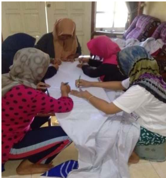
Gambar 3.5 Proses Memindahkan Corak Batik di Kain

para pegawainya tergantung pada lebar kain dan gambar sketsa yang akan dipindahkan.