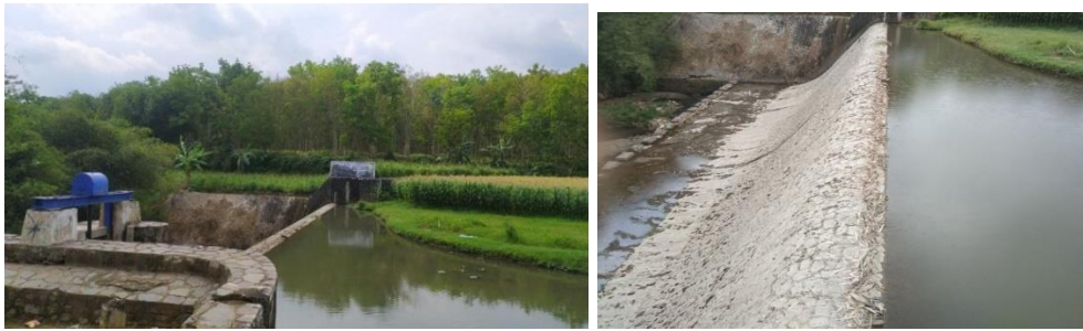
Gambar 1. Kondisi bangunan utama Bendung Tempurejo