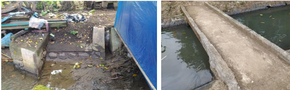
Gambar 2. Kondisi bangunan penunjang