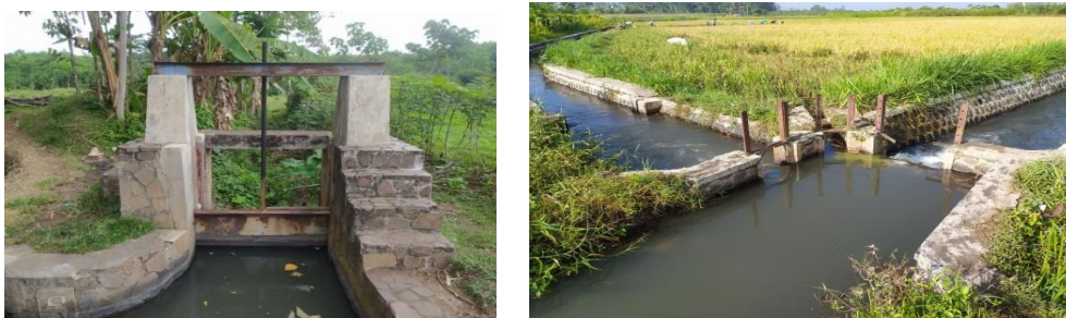
Gambar 3. Kondisi pintu intake dan bangunan pembagi