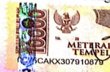
Ainun Nur Fitriyana