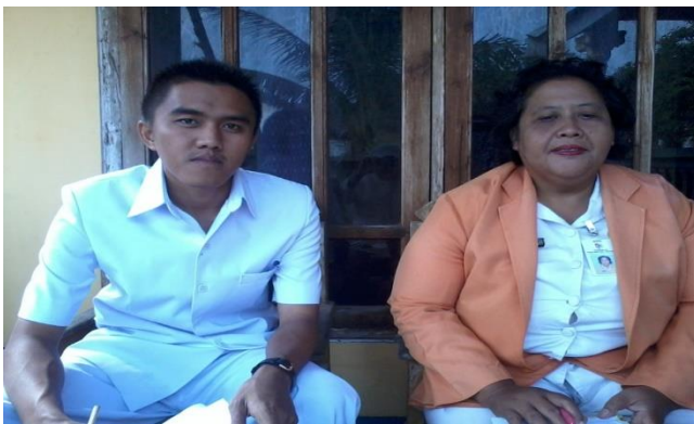
Gambar 9. Bersama Bidan Desa Menetapkan 10 Kader Posyandu dan 10 Wanita Usia Subur

Berikut ini dokumentasi selama kegiatan pelaksanaan pengabdian yang dilaksanakan oleh peneliti dan tim :