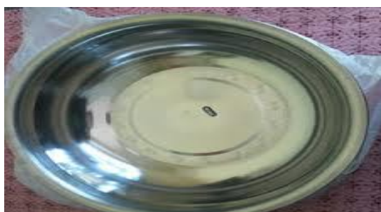
Gambar 5. Washkom