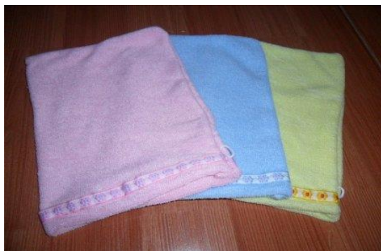
Gambar 4. Washlap