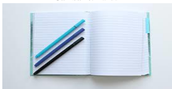
Gambar 8. Alat Tulis