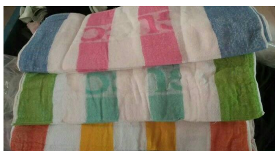
Gambar 6. Handuk