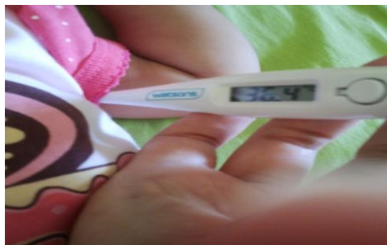
Gambar 5. Thermometer