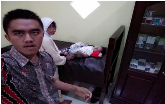
Gambar 11. Menentukan wanita usia subur dan melaksanakan pelatihan pada wanita usia subur dengan anak demam