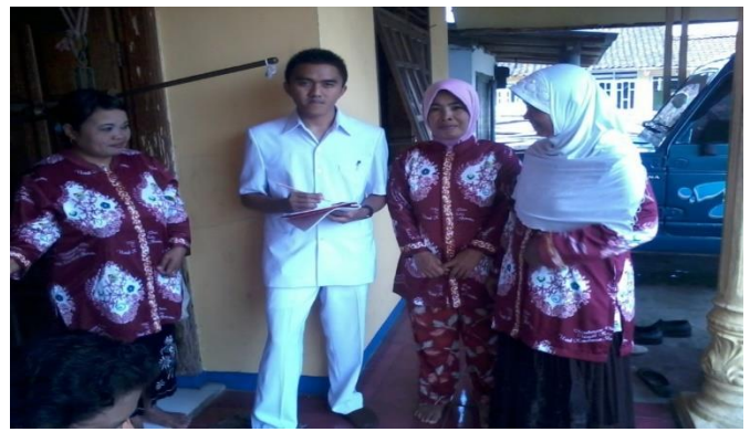
Gambar 10. Menentukan Kader Posyandu yang akan diberikan pelatihan