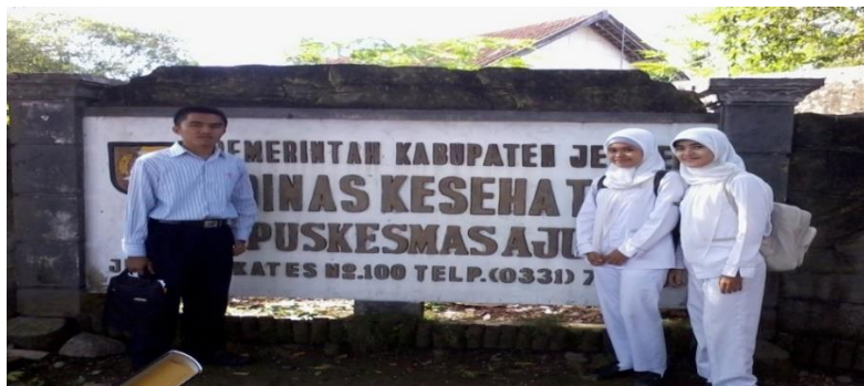
Gambar 2. Koordinasi Dengan Mitra

Koordinasi dengan mitra Posyandu Desa Wirowongso yang merupakan kepanjangan tangandari Puskesmas Ajung dilakukan langsung dengan menemui bidan desa yang bertempat tinggal di Puskesmas Pembantu Desa Wirowongso Wilayah kerja Puskesmas Ajung. Mitra meyepakati rencana kegiatan yang telah di susun oleh tim Pengabdian dan menunggu koordinasi lanjutan antara tim pengabdian dengan posyandu untuk persiapan dan pelaksanaannya.