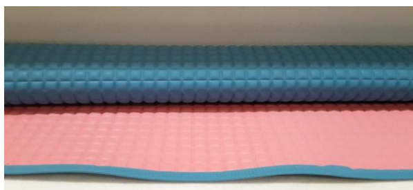
Gambar 7. Perlak