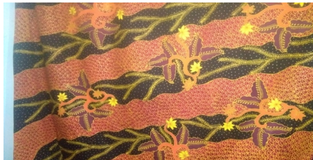
Gambar 7 Motif Alun Baruno

Motif berikutnya adalah Alun Baruno. Motif ini menggambarkan gelombang laut yang menyimbolkan gelombang kehidupan. Kadang-kadang di atas kadang-kadang di bawah, menyesuaikan tempat yang dilewati dan mendatangi tempat-tempat landai.