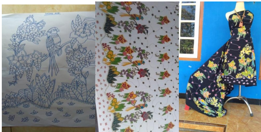
Gambar 5 Corak Sasono Asri

Corak ketiga dinamakan Sasono (tempat) Asri (indah). Mitra ingin menggambarkan lingkungan dusun Langon yang subur. Lingkungan ini hendaknya dipelihara agar tetap lestari. Jika alam rusak maka yang akan menderita adalah manusia sendiri. Alam yang rusak mendatangkan bencana bagi manusia, maka jagalah alam.