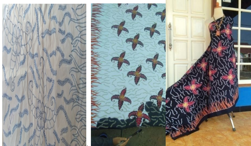
Gambar 4 Corak Nugroho Agung

Corak ketiga dinamakan Sasono (tempat) Asri (indah). Mitra ingin menggambarkan lingkungan dusun Langon yang subur. Lingkungan ini hendaknya dipelihara agar tetap lestari. Jika alam rusak maka yang akan menderita adalah manusia sendiri. Alam yang rusak mendatangkan bencana bagi manusia, maka jagalah alam.