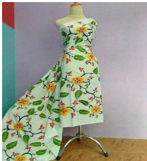
Gambar 1 Corak daun tembakau dan bunga

Corak-corak modern atau kontemporer kini bisa dijumpai di seluruh penjuru tanah air (Ansari Bukhari, Kina, 2013) tak terkecuali di Kabupaten Jember. Sebagai daerah pertanian, komoditas tembakau tumbuh dengan subur. Tembakau Jember sangat terkenal hingga Bermen, Jerman. Cerutu terbaik dunia, tembakaunya disuplai oleh petani-petani tembakau Jember. Keunggulan ini mengilhami pembatik Jember, dan mengabadikan daun tembakau sebagai coraknya. Namun ketika rokok dinyatakan membahayakan bagi kesehatan, ada kekhawatiran orang akan berpaling dari batik Jember. Kekhawatiran ini telah melahirkan kreasi baru dengan mengeksplorasi komoditas kopi dan kakao menjadi corak batik. Komoditas kopi dan kakao yang juga menjadi produk unggulan Jember telah mengilhami pembatik sehingga menghasilkan corak uwoh kopi, godong kopi, ceplok kakao, kakao raja, kakao biru, wiji mukti (Salma, 2015: 67-69).