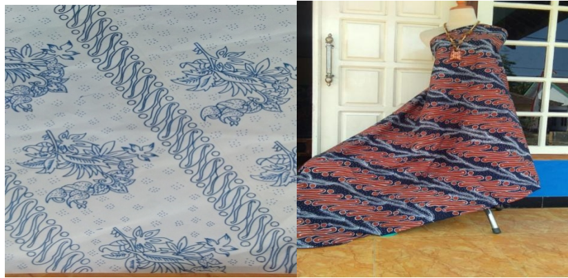
Gambar 6 Corak Liris Langon

Motif Liris Langon menggambarkan kehidupan masyarakat yang beragam namun mengutamakan nilai-nilai kebersamaan, selalu menjaga kerukunan dan ringan tangan dalam membantu sesama. Filosofi ini digambarkan oleh gambar bermacam-macam daun namun daun tersebut menyatu. Pemakai batik motif Liris Langon diharapkan memiliki jiwa yang luhur dan mengutamakan kebersamaan.