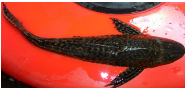
Gambar 6 Hypostomus sp

Ikan sapu-sapu memiliki tubuh yang ditutupi oleh sisik keras kecuali pada bagian perutnya, bentuk tubuh pipih, kepala lebar, mulut terletak dibagian perutnya dan berbentuk cakram. Semua sirip kecuali sirip ekor selalu diawali dengan sirip keras. Sirip punggung lebar dengan 7 jari-jari lemah. Warna tubuh coklat dengan bintik-bintik hitam diseluruh tubuh.