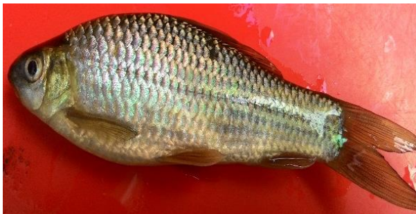
Gambar 2 Osteochilus sp

Ikan ini termasuk dalam familia Cyprinidae yang memiliki bentuk tubuh tidak terlalu besar dan panjang sekitar 7 cm. Bentuk tubuh hampir serupa dengan ikan mas. Bedanya, pada bagian kepala lebih kecil. Pada sudut-sudut mulutnya, terdapat dua pasang sungut peraba. Warna tubuhnya hijau abu-abu. Sirip punggung memiliki 3 jari-jari keras dan 12-18 jari-jari lunak. Sirip ekor berbentuk cagak dan simetris. Sirip dubur disokong oleh 3 jari-jari keras dan 5 jari-jari lunak. Sirip perut disokong oleh 1 jari-jari