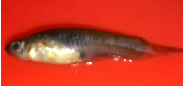
Gambar 3 Rasbora sp

Ikan ini termasuk dalam familia Cyprinidae yang memiliki kepala menggepeng datar, mempunyai sepasang mata jernih, tubuh memanjang, bersisik tipis, terdapat garis kehitaman di bagian tengah badan, panjang sirip perut dalam satu garis horizontal, jari-jari sirip dada terluar tidak bercabang, dan memiliki panjang sekitar 2-3 cm. Tubuh berwarna hitam keabu-abuan di bagian atas ( dorsalis ) dan putih keperakan di sisi dan bagian bawah, terutama di bagian perut. Sebuah garis keemasan di dalam, berjalan bersama garis kehitaman di bagian luar pada masing-masing sisi tubuh. Sirip punggung tidak berjari keras menulang.