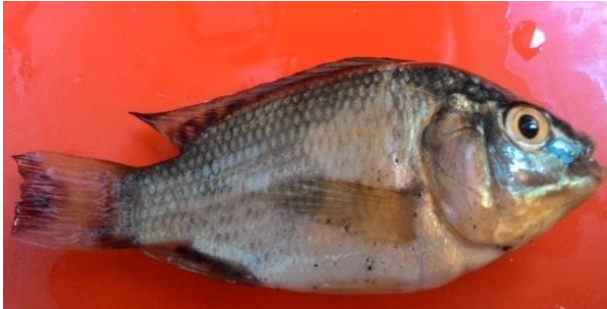
Gambar 1 Oreochromis sp

Ikan ini termasuk dalam familia Cichlidae yang memiliki bentuk tubuh tidak terlalu besar dan panjangnya sekitar 10 cm. Memiliki sirip berpasangan, sirip punggung, sirip perut, sirip anus, dan sirip ekor. Letak mulut subterminal dan berbentuk meruncing. Warna tubuhnya yang hitam dan agak keputihan. Bagian bawah tutup insang berwarna putih. Sisik-sisik berukuran kecil dan kasar. Linea lateralis bagian atas memanjang mulai dari tutup insang hingga belakang sirip punggung sampai pangkal sirip ekor. Ukuran kepalanya relatif kecil dengan mulut berada di ujung kepala serta mempunyai mata yang besar.