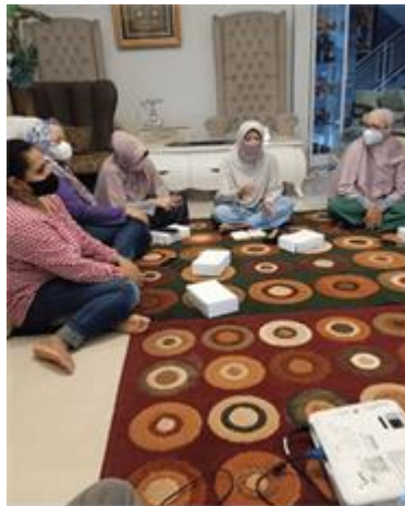
Gambar 1. Sosialisasi urban farming di Dasa Wisma 03

Program ini didahului dengan melakukan sosialisasi yang melibatkan unsur terkait, yaitu pengurus dan seluruh anggota pengurus Dasa Wisma 03 Perumahan Puri Bunga Nirwana, dan Tim pelaksana dari Universitas Muhammadiyah Jember serta ada beberapa tokoh masyarakat yang ada di Perumahan Puri Bunga Nirwana Kabupaten Jember. Sosialisasi ini diberikan dalam bentuk diskusi mengenai berbagai aspek pengembangan potensi yang dimiliki oleh Dasa Wisma 03 Perumahan Puri Bunga Nirwana. Inti dari sosialisasi ini yang disampaikan meliputi: pengelolaan lahan sempit, untuk dikembangkan menjadi unit bisnis Dasa Wisma 03 Perumahan Puri Bunga Nirwana.