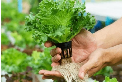
Gambar 9. Cara panen hidroponik

Teknik panen sayuran hidroponik yang kedua adalah panen sebagian. Cara pemanenan ini dapat dilakukan dengan memanennya hanya sebagian. Hanya jenis tanaman sayuran tertentu yang dapat dipanen dengan teknik ini, yakni sayuran tanaman daun yang dapat tumbuh kembali. Beberapa jenis sayuran tersebut adalah seledri, stevia, kale, dan mint. Kangkung juga dapat dipanen dengan teknik panen sebagian. Namun, kangkung juga dapat dipanen langsung tergantung keperluan. Tanaman kangkung yang dipanen sebagian dapat dipanen hingga tiga kali terlebih dahulu. Baru setelah itu, kangkung akan dipanen secara keseluruhan. Teknik panen sebagian ini harus dilakukan dengan lebih hati-hati ketimbang panen sekaligus.