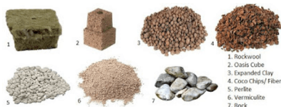
Gambar 6. Formula dari media tanam

Untuk media tanam Anda bisa menggunakan campuran sekam bakar dan pasir kerikil yang ditempatkan ke dalam barang bekas seperti sudah disebutkan diatas, atau bisa juga menggunakan pot biasa. Selain pasir kerikil Anda juga dapat menggunakan media lain seperti sabut kelapa, akar/batang pakis, pecahan bata atau genteng, dan lain-lain.