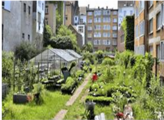
Gambar 2. Konsep urban farming

dan kangkung. Sementara itu, tanaman herbal yang dapat dibudidayakan adalah jahe, sereh, lengkuas dan jenis lainnya. Pengelolaan usahatani tanaman-tanaman tersebut di atas adalah sangat mudah dengan menggunakan teknologi yang sederhana sampai dengan yang kompleks. Penggunaan teknologi yang lebih banyak biasanya digunakan untuk budidaya tanaman hias dan tanaman yang ditujukan untuk memperoleh nilai komersial yang lebih tinggi. Beberapa metode urban farming yang menggunakan aplikasi teknologi untuk dikembangkan oleh generasi muda termasuk mereka yang terkena dampak Covid19 adalah sebagai berikut: (i) metode vertikultur, yaitu budidaya tanaman secara vertikal; (ii) metode hidroponik, yaitu penanaman tanaman tanpa media tanah tetapi menggunakan air dan penambahan unsure hara tertentu; (iii) metode akuaponik; dan (iv) metode wall gardening. Penerapan teknologi urban farming secara vertikultur dapat dilakukan dengan menggunakan: paralon atau bahan lainnya secara bertingkat yang dapat dilakukan pada ruangan yang kecil. Beberapa jenis tanaman yang bisa dibudidayakan dengan metode ini di antaranya adalah sawi, bayam, seledri, dan kucai. Beberapa contoh tanaman yang dibudidayakan dalam urban farming, dapat dilihat pada Gambar 2.