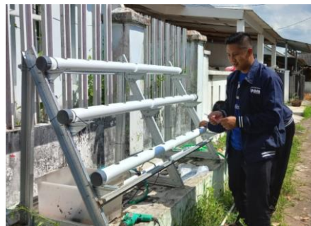
Gambar 3. Perakitan Hidroponik

Rak atau rangka dari kayu untuk penopang pipa dibuat terlebih dahulu. Model di atas mengadopsi model rak jemuran yang bisa dilipat. Lebar dibuat sepanjang 350 cm untuk menopang panjang pipa 370 cm (ujung pipa bagian sambungan dipotong dulu). Tinggi rak posisi miring 180 cm. Untuk model vertikal kultur pipa dapat menempel pada tembok, rak kayu tentunya tidak diperlukan lagi. Buat lubang untuk netpot pada pipa-pipa. Jarak antar lubang disesuaikan keperluan. Untuk jumlah banyak bisa dibuat jarak antar pusat lubang 10 cm. Untuk keperluan ini bisa digunakan alat bor atau solder listrik. Pasang pipa dengan klem pada rak kayu. Pada model ini posisi pipa dibuat mendatar tanpa kemiringan sehingga ketinggian air saat diam akan sama sepanjang pipa. Untuk keperluan ini, sebelum klem dipaku pada kayu bisa disetel dulu dengan cara pipa ditali atau digantung dulu dengan tali rafia ke palang kayu bagian atas. Pipa kemudian diisi dengan air hingga diperoleh posisi terbaiknya, air tergenang merata di sepanjang pipa pralon.