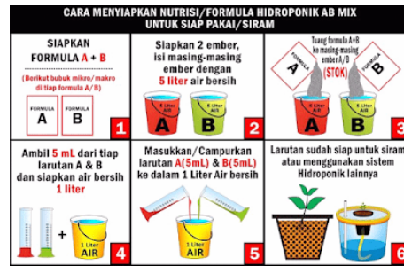
Gambar 7. Cara menyiapkan nutrisi hidroponik

Setelah bibit dan media tanam sudah siap, Anda dapat memindahkan bibit dari tempat penyemaian. Lubangi media tanam kurang lebih 1-2cm kemudian tanam bibit disana. Untuk pemberian nutrisi, jika Anda menggunakan teknik sumbu atau wick, maka Anda tidak perlu menyiramkan air nutrisi secara manual pagi dan sore. Pemberian nutrisi ini sangat penting, Anda dapat meracik sendiri atau membeli nutrisi hidroponik yang sudah jadi di pasaran.