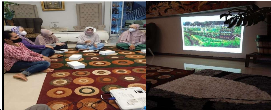
Gambar 10. Kegiatan Pelatihan Pengelolaan Urban Farming

Terakhir, jenis panen sayuran hidroponik ini adalah teknik panen berkala. Panen dilakukan pada masa produktif tanaman sedang berlangsung. Panen berkala dilakukan jika tipe tanaman sayur yang ditanam adalah sayuran buah. Beberapa jenis sayuran yang dipanen dengan teknik panen berkala adalah cabai, tomat, terung, semangka, melon, dan buah atau sayuran buah lainnya. Setelah tidak produktif, tanaman akan diganti dengan bibit baru.