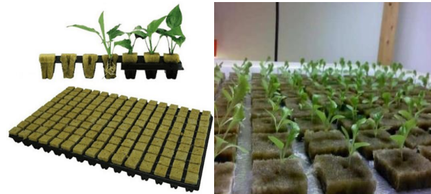
Gambar 5. Penyemaian dan pembibitan hidroponik

Semaikan benih atau bibit yang akan ditanam terlebih dahulu dengan menggunakan media rockwool, yaitu semacam batu vulkanik yang telah dipanaskan sehingga steril dari hama tanaman. Tanam benih sekitar 2-3 benih untuk setiap rockwool menggunakan pinset. Basahi rockwool yang sudah diberi benih lalu letakkan di tempat gelap dan tunggu hingga berkecambah. Setelah itu pindahkan ke tempat terang namun hindari sinar matahari langsung, dan sirami dengan air pagi dan sore secukupnya. Tunggu kira-kira sekitar 1-2 minggu, setelah tumbuh maka tanaman siap dipindahkan ke media tanam.