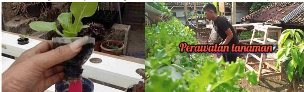
Gambar 8. Perawatan hidroponik

Perawatan tanaman hidroponik umumnya tidak berbeda jauh seperti perawatan tanaman biasa, yaitu menyangi gulma, pemangkasan, dan lain-lain. Selain itu, Anda juga perlu memastikan agar tanaman terhindar dari hujan dan mendapat sinar matahari yang cukup. Jangan biarkan nutrisi sampai kosong karena dapat menyebabkan tanaman mati kekeringan.