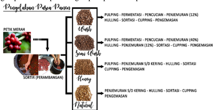
Gambar 2. Tahapan Prosesing Biji Kopi

Materi pertama disampaikan oleh Dr. Ir. Teguh Hari Santoso, MP yang menjelaskan tentang prosesing kopi. Inti dari prosesing kopi dapat dilihat pada Gambar 2.