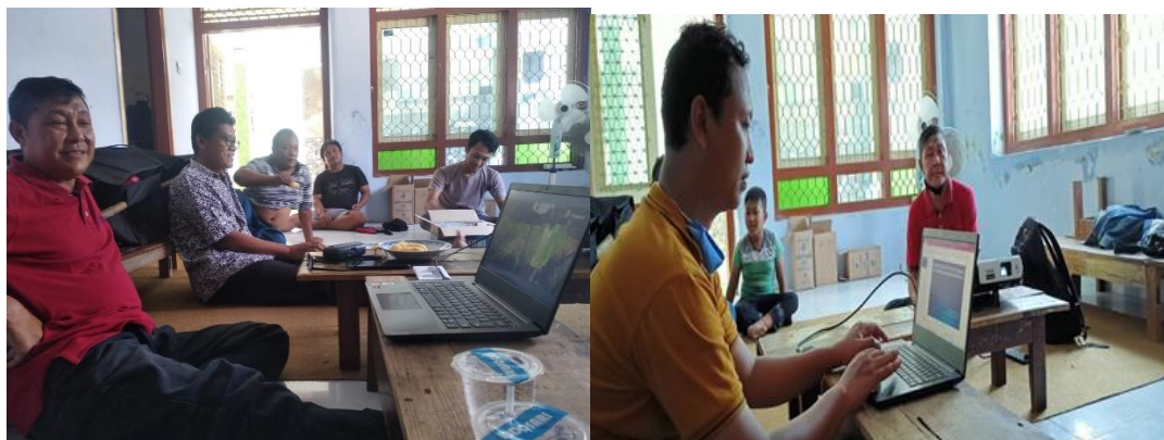
Gambar 5. Kegiatan Pelatihan Pengelolaan Budidaya Lele secara Aquaponik