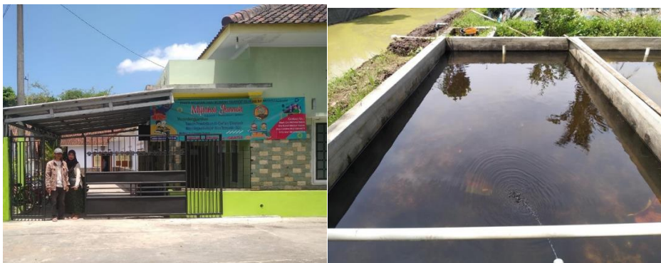
Gambar 1. Situasi Yayasan Miftahul Janna

Melihat potensi yang dimiliki oleh Yayasan Miftahul Jannah yang memiliki kolam perikanan ikan lele, perlu dilakukan pengembangan potensi produksi kolam ikan lele yang di Kelola oleh Yayasan Miftahul Jannah. Pemberdayaan Anak Yatim melalui Pengembangan Aquaponik sebagai upaya untuk peningkatan Produktivitas Kolam Ikan Lele.