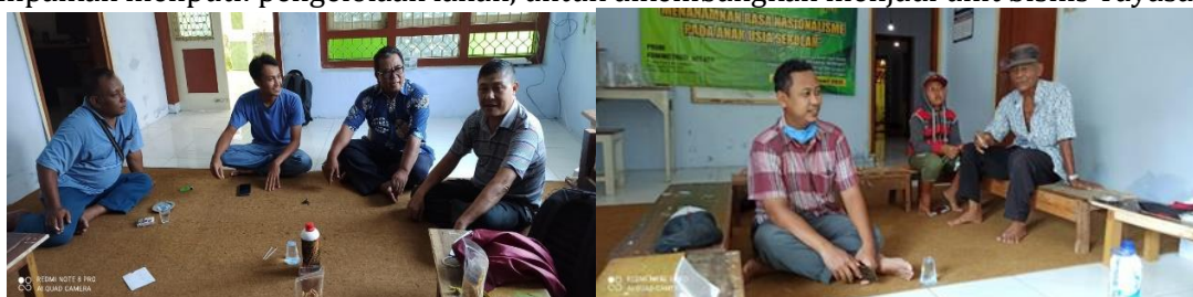
Gambar 3. Sosialisasi Budidaya lele secara Aquaponik di Yayasan Miftahul Janna

Program ini didahului dengan melakukan sosialisasi yang melibatkan unsur terkait, yaitu pengurus dan seluruh anggota pengelola Yayasan Anak Yatim “Miftahul Janna, serta pimpinan cabang Muhammadiyah Bangsalsari dan Tim pelaksana dari Universitas Muhammadiyah Jember serta adabeberapa tokoh masyarakat yang ada di wilayah Kecamatan Bangsalsari Kabupaten Jember. Sosialisasi ini diberikan dalam bentuk diskusi mengenai berbagai aspek pengembangan potensi yang dimiliki oleh Yayasan Anak Yatim Miftahul Janna. Inti dari dari sosialisasi ini yang disampaikan meliputi: pengelolaan lahan, untuk dikembangkan menjadi unit bisnis Yayasan