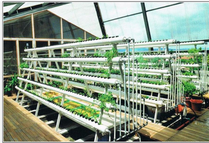
Gambar 4. Ilustrasi Rak Hidroponik

Konstruksi rak hidroponik untuk budidaya lele secara aquaponik sama dengan konstruksi rak hidroponik yang bisanya (gambar 4). Saat ini bahan pembuatan rak hidroponik banyak digunakan dari besi baja ringan, hal ini di karenakan bahannya kuat, tahan air dan ekonomis