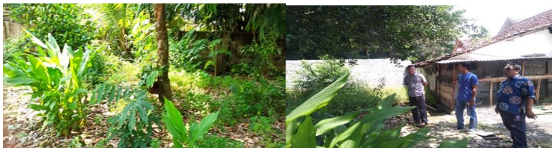
Gambar 2. Rencana Lokasi Pengembangan Budidaya Lele Secara Aquaponik

Dalam usulan pengabdian masyarakat ini, ada beberapa solusi yang diharapkan bisa mengurangi masalah yang dihadapi mitra, khususnya dalam pengelolaan potensi yang dimiliki oleh Yayasan Miftahul Jannah. Solusi yang ditawarkan diantaranya dengan program pendampingan pengelolaan budidaya ikan lele secara aquaponik secara bertahap dan sistematis. Kegiatan pendampingan dilakukan secara bertahap, yaitu mulai dari tahapan pelatihan hingga pendampingan budidaya daya lele secara aquaponik