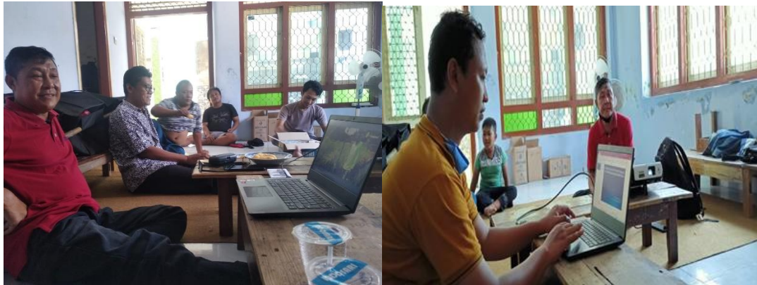
Gambar 5. Kegiatan Pelatihan Pengelolaan Budidaya Lele secara Aquaponik