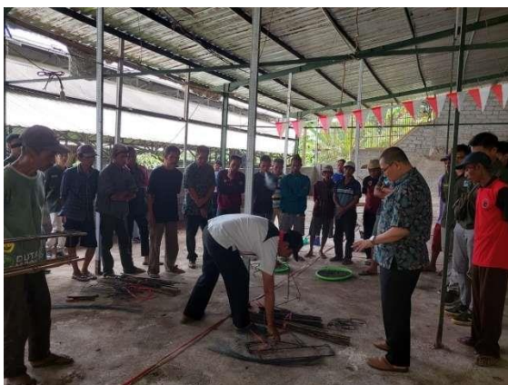
Gambar 5. Praktek Membuat Fero semen

Alat yang diperlukan untuk membuat fero semen terdiri dari palu, pahat, roskam, cangkul, sendok semen, gunting kawat, ember serta botol kecap.