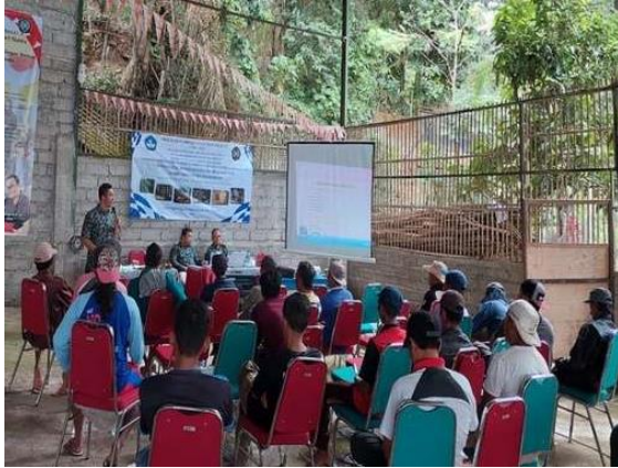
Gambar 4. Penyampaian Teori Teknologi Fero semen dan Beton Bertulang Bambu

Kegiatan PKMS ini dihadiri 20 Tukang dari 3 Dusun.