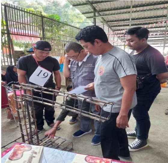
Gambar 6. Praktek Membuat Beton Bertulang Bambu

dibersihkan pada sisi dalam dan dipangkas dengan mesin gerinda menjadi bentuk tulangan beton berukuran 15 x 15 mm 2 . Perapian permukaan tulangan bambu dengan mesin gerinda. Persiapan bahan dan alat yang terdiri dari tulangan bambu, lapis kedap air, pasir halus, penjepit selang, dan sikat. Pelapisan perekat lapis kedap air pada tulangan bambu. Pelaburan pasir pada tulangan bambu. Perangkaian tulangan bambu untuk pondasi, kolom, balok, dan hubungan balok-kolom