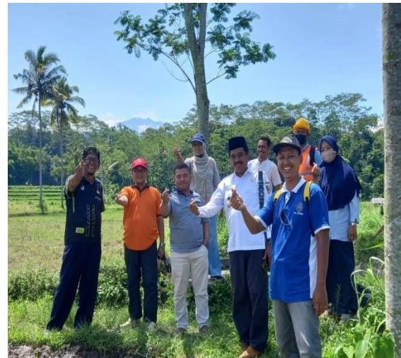
Gambar 3. Koordinasi Lapangan Antara Tim Dan Pemerintah Desa

beberapa hal, diantaranya, pertama Tim Ahli dari Universitas Muhammadiyah Jember akan memberikan penyuluhan dan Pelatihan bagi para Tukang. Kedua, Pemerintah desa akan menjadi mitra yang siap memfasilitasi tempat dan semua peralatan yang dibutuhkan dalam kegiatan Program Kemitraan Masyarakat Stimulus ini. Ketiga, Para Tukang dan Warga akan menjadi peserta kegiatan PKMS ini.