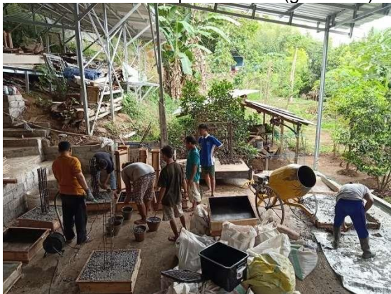
Gambar 7. Praktek Pengecoran Tulangan Bambu

Setelah bambu dirangkai sebagai tulangan pondasi, tulangan kolom serta tulangan balok, praktek terakhir yang dilakukan adalah cara mengecor. Dalam mengecor tulangan ini tukang harus memperhatikan agar tulangan tetap lurus, presisi tidak tertekan oleh beban yang ditimbulkan oleh campuran beton (gambar 6).