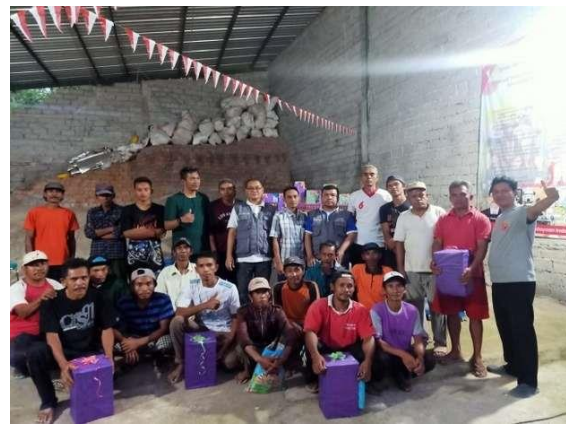
Gambar 8. Penguatan Kelompok Tukang

Dengan adanya kegiatan PKMS ini, maka keterampilan tukang bertambah baik secara kuantitas maupun kualitas. Pada periode sebelumnya para tukang dilatih untuk membuat beton bertulang bambu, pada saat ini tukang diberi tambahan keterampilan dengan menerapkan teknologi ferosemen.