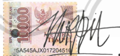
Nur Fatimah Fit Asma