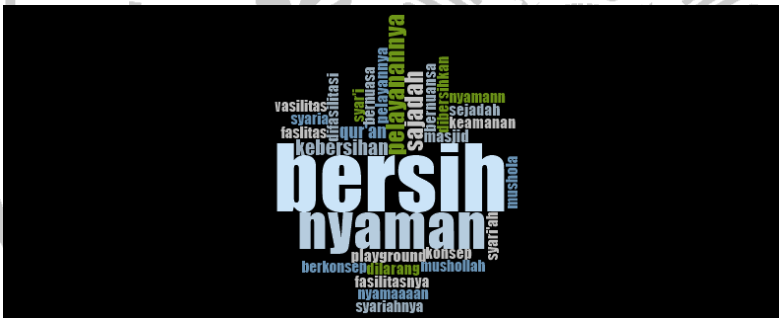
Gambar 2 faktor penentu pengunjung hotel syariah menjadikan hotel syariah sebagai pilihan utama.

Menurut KBBI (kamus besar bahasa Indonesia) faktor memiliki arti sesuatu hal yang dapat mempengaruhi/menyebabkan terjadinya sesuatu.Faktor faktor yang menjadi oenentu pengunjung hotel syariah menjadikan hotel syariah daerah tapal kuda sebagai pilihan utama memesan kamar terdapat beberapa faktor yang menjadi penentu pemilihan hotel bagi para pengunjung hotel syariah yaitu dapat dilihat dari hasil penelitian pada gambar di bawah ini: