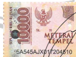
Dido Oksi Sugiarto