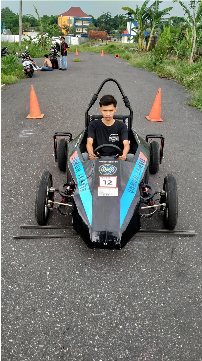
Lampiran 1. Driver 1 beban total 200 Kg