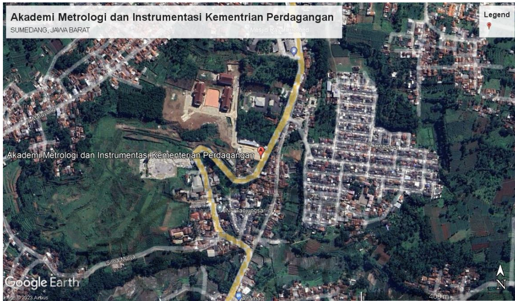
Gambar 3. 1 Denah Lokasi Penelitian