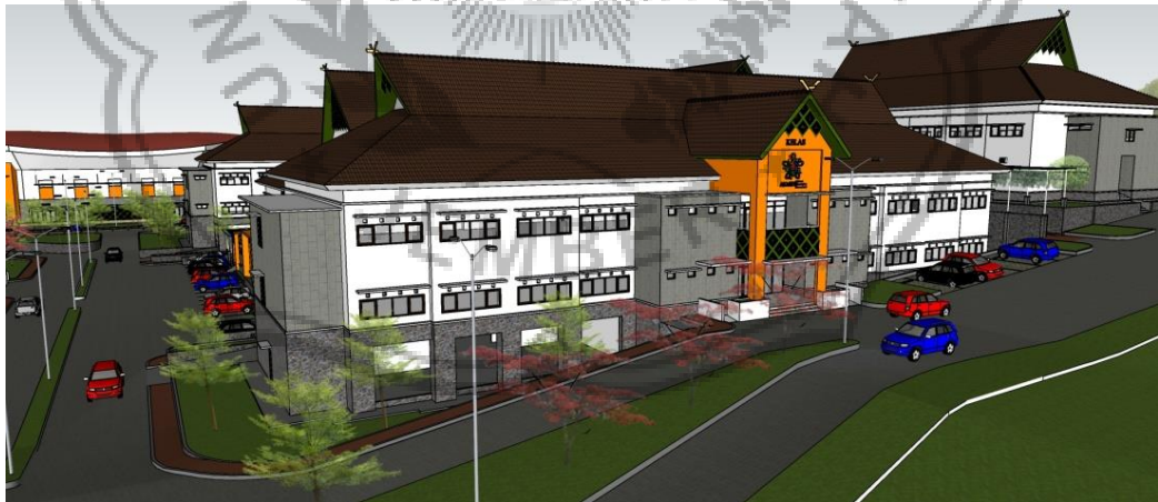
Gambar 3. 2 Tampak Gedung Akademi Metrologi

Alamat lokasi penelitian berada di Jalan Cihanjuang Kecamatan Parompong, Kabupaten Bandung Barat.