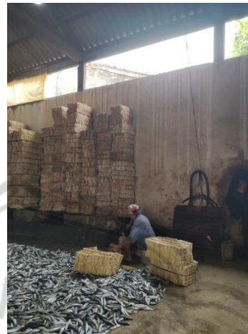
Bahan Baku Ikan Segar