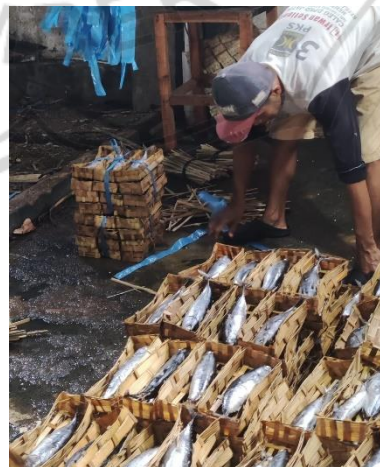
Produk Jadi Ikan Pindang