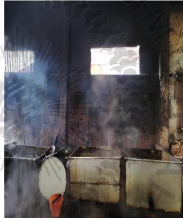
Proses perebusan ikan