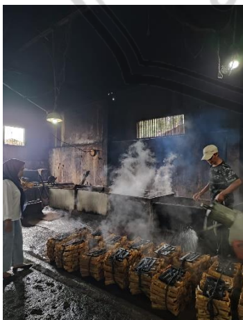
Proses penyiraman Ikan