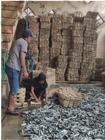
Proses menata ikan dibesek