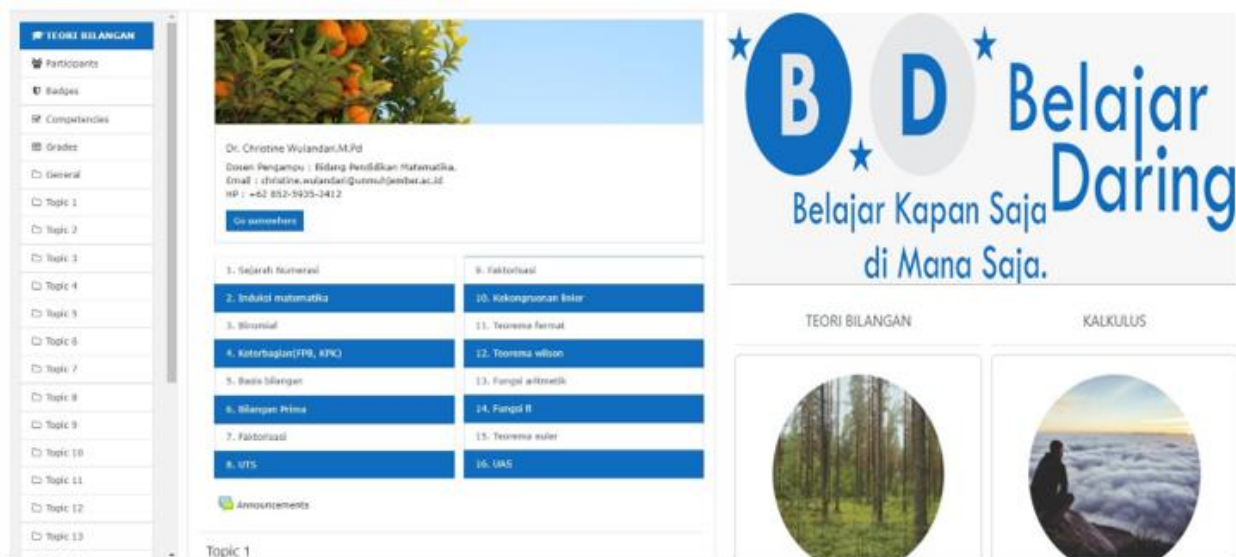
Gambar 2. Tampilan pengembangan produk yang telah direvisi

Pada aspek tampilan, tampilan login dan beranda website yang digunakan menarik dengan kesesuaian proporsi warna, tampilan pemilihan gambar yang baik, dinamis dan menarik tampilan website. Selain hal itu, layout website yang dibuat responsif, judul website jelas dan memiliki kesesuaian dengan perkembangan ilmu pengetahuan dan teknologi terbaru. Hasil akhir pengembangan media evaluasi berbasis web dengan moodle dan mathjax adalah sebagai berikut