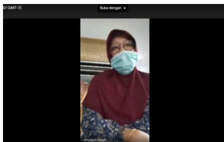
Gambar 3. Foto Kegiatan Pengabdian

Modul kegiatan pembelajaran terdiri atas 20 bab. Kedua puluh bab tersebut merupakan contoh pemanfaatan barang bekas sebagai alat permainan edukatif anak guru di Pendidikan Anak Usia Dini. Semua contoh dibuat dalam bab-bab sesuai dengan bahan-bahan yang bisa dimanfaatkan. Kelebihan dari modul ini adalah penjelasan manfaat penggunaan alat permainan edukatif dengan cara / Perencanaan Kurikulum 13 Tahun 2013 tentang standar proses pembelajaran pada cabang perkembangan anak. Semua alat permainan edukatif yang dijelaskan disusun dengan sistematis yang kemudian, sehingga memudahkan pembaca dalam memahami penggunaan dan manfaatnya dalam pembelajaran anak usia dini. Sebagai modul ini bermanfaat untuk peningkatan mutu penyelenggaraan Pendidikan Anak Usia Dini. Guru dapat berkreasi menggunakan aneka bahan-bahan, sehingga pelaksanaan pembelajaran anak usia dini benar-benar didesain menyenangkan dan mengandung unsur edukasi yang tinggi.