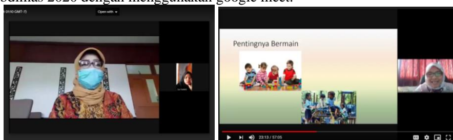
Gambar 2. Foto Kegiatan Pengabdian

Kegiatan Abdimas tahun ini dilaksanakan melalui google meeting. Penggunaan google meeting ini sesuai dengan kondisi analisis kebutuhan pengembangan media pelaksanaan kegiatan di saat pandemi Covid 19. Mekanismenya adalah pelaksana Abdimas mengirim undangan kepada ketua Himpaudi. Ketua Himpaudi yang membagikan tautan undangan kepada peserta Abdimas. Melalui google meeting ini, secara tidak langsung, kegiatan Abdimas 2020 memberikan pengalaman belajar online secara langsung kepada guru PAUD. Ini akan menjadi salah satu bekal dalam pengembangan pembelajaran online di sekolah masing-masing. Berikut tampilan pada pelaksanaan Abdimas 2020 dengan menggunakan google meet.