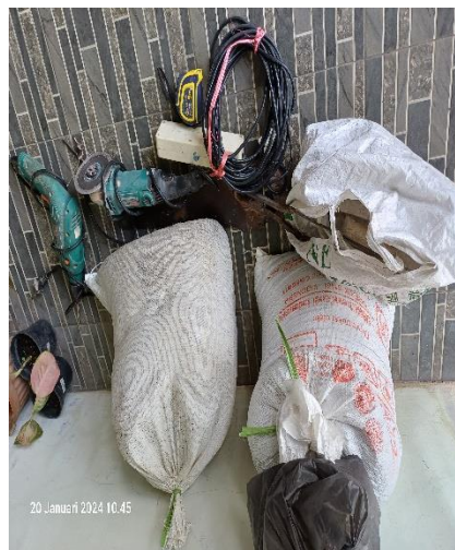
Gambar 4. Bahan dan Alat PKMS

Kegiatan ini tidak selain untuk meningkatkan pemahaman, juga bertutuan untuk meningkatkan keterampilan peserta (Anshari, B., Kencanawati, N. N., Ngudiyono, Hariyadi, Fajrin, 2021). Oleh karenanya, selain pendampingan dan penyuluhan juga dilakukan kegiatan simulasi. Agar kegiatan simulasi ini berhasil dan berjalan secara maksimal maka sebelum kegiatan harus disiapkan alat dan bahan untuk membuat teknologi ferosemen (Anshari, B., Kencanawati, N. N., Ngudiyono, Hariyadi, Fajrin, 2022). Adapun bahan yang dibutuhkan dalam membuat teknologi ferosemen ini terdiri dari pasir, semen, kawat bendrad, kawat wiremesh, paku payung (Aminudin et al., 2022). Sedangkan peralatan yang dibutuhkan untuk membuat teknologi ferosemen ini terdiri dari palu, roskam, sendok semen, bor, cangkul, pengayak pasir, kabel olor dan alat-alat lain yang dibutuhkan sesuai dengan konteks situasi dan tempat pelaksanaan. Selain peralatan yang terkait simulasi, juga dibutuhkan peralatan terkait pelaksanaan bimbingan seperti LCD, banner, kertas, papan tulis, peralatan serta tempat pelaksanaan.