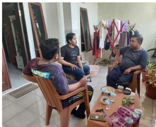
Gambar 3. Koordinasi antara Tim dan Mitra

Kegiatan observasi dilakukan untuk mengetahui semua permasalahan yang dihadapi oleh mitra. Seluruh masalah tersebut kemudian diseleksi untuk dicarikan detilnya. Hal ini dilakukan agar dapat diketahui Langkah-langkah penyelesaiannya secara detil pula. Demikian ini juga bermanfaat siapa saja pakar yang berasal dari Universitas Muhammadiyah Jember yang akan dilibatkan dalam kegiatan ini.