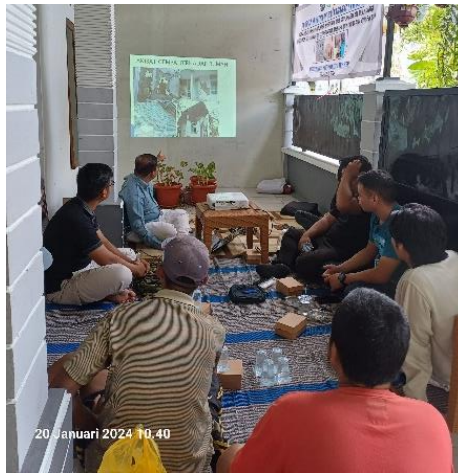
Gambar 5. Bimbingan dan Penyuluhan Mengenai Teknologi Ferosemen

Metode yang digunakan dalam kegiatan bimbingan dan penyuluhan ini berupa ceramah, brainstorming serta tanya jawab (Gunasti, Sanosra, et al., 2022). Metode ceramah dilakukan oleh tim pelaksana sebagai pengantar dengan menerangkan Panjang lebar terkait teknologi ferosemen (Gunasti, Ma'ruf, et al., 2022). Metode brainstorming dilakukan dengan memberikan kesempatan kepada peserta untuk mengeksplorasi dan mendalami materi yang diberikan. Metode tanya-jawab dilakukan dengan memberi kesempatan kepada peserta menyampaikan pertanyaan (Sanosra et al., 2023).