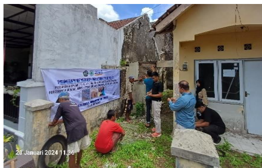
Gambar 6. Simulasi Penerapan Teknologi Ferosemen

Kegiatan simulasi langsung dilakukan dengan membedah rumah warga yang mengalami retak akibat gempa bumi. Kegiatan dimulai dengan menguliti rumah pada bagian retak pada dua sisi dinding. Langkah berikutnya memberi paku payung dengan ukuran presisi antara 10-25 cm. Dinding dilubangi sebagai konektor antara wiremesh pada dinding bagian dalam dan bagian luar. Setelahnya, wiremesh dipasang baik pada dinding bagian dalam maupun dinding bagian luar. Selanjutnya, kawat bendrad dipasang pada lubang yang telah dibuat dengan mengikatkan pada wiremesh dinding sisi dalam dan luar. Langkah terakhir adalah melapisi wiremesh dengan plester, sehingga dinding terlihat rapi.