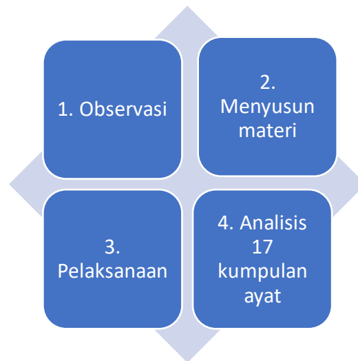
Gambar 1. Metode Pelaksanaan Kegiatan

Universitas Muhammadiyah, anggota cabang maupun ranting Aisyiyah Kabupaten Jember. Kegiatan ini dilakukan secara daring dan diikuti kurang lebih 70 peserta. Metode pelaksanaan yang dilakukan oleh peneliti melalui 4 tahapan sebagai berikut: