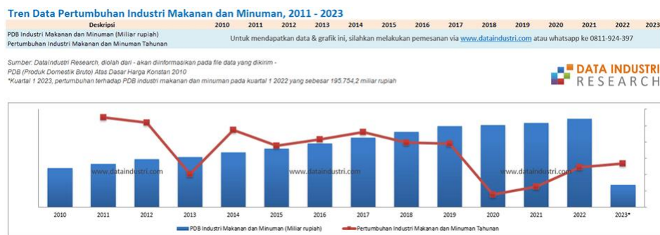
Gambar 1. Grafik Trend Data Pertumbuhan Industri Makanan Minuman Tahun 2011-2023