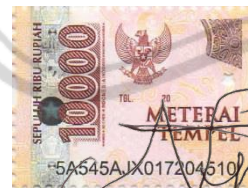
Nurhadi Dwi Pamungkas