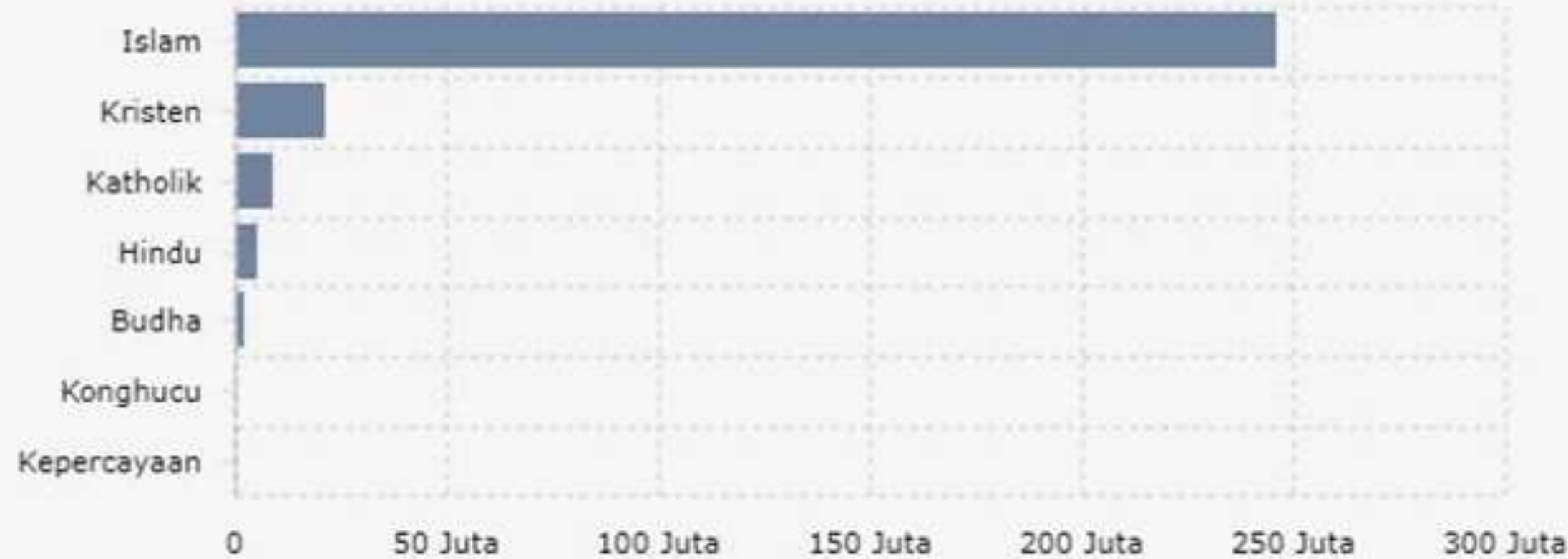
Jumlah Penduduk Indonesia Berdasarkan Agama (Semester I 2024)